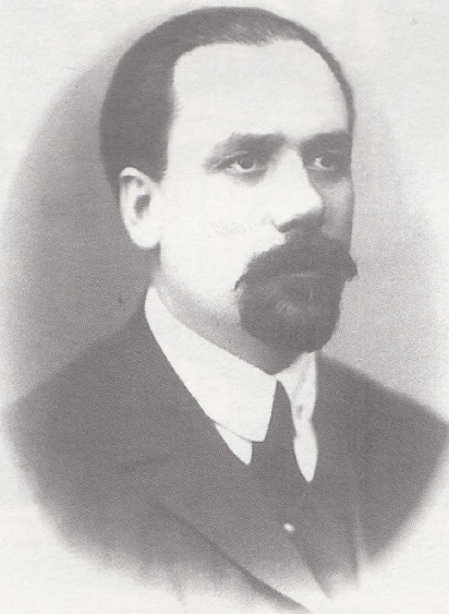
▼ Pan Halippa